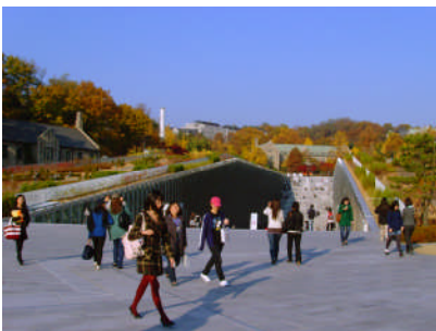
Université féminine Ewha – Séoul (© DPA/Adagp)

Originaire de Clermont-Ferrand, Dominique Perrault, est l'auteur de nombreux projets en France, en Europe et au-delà :